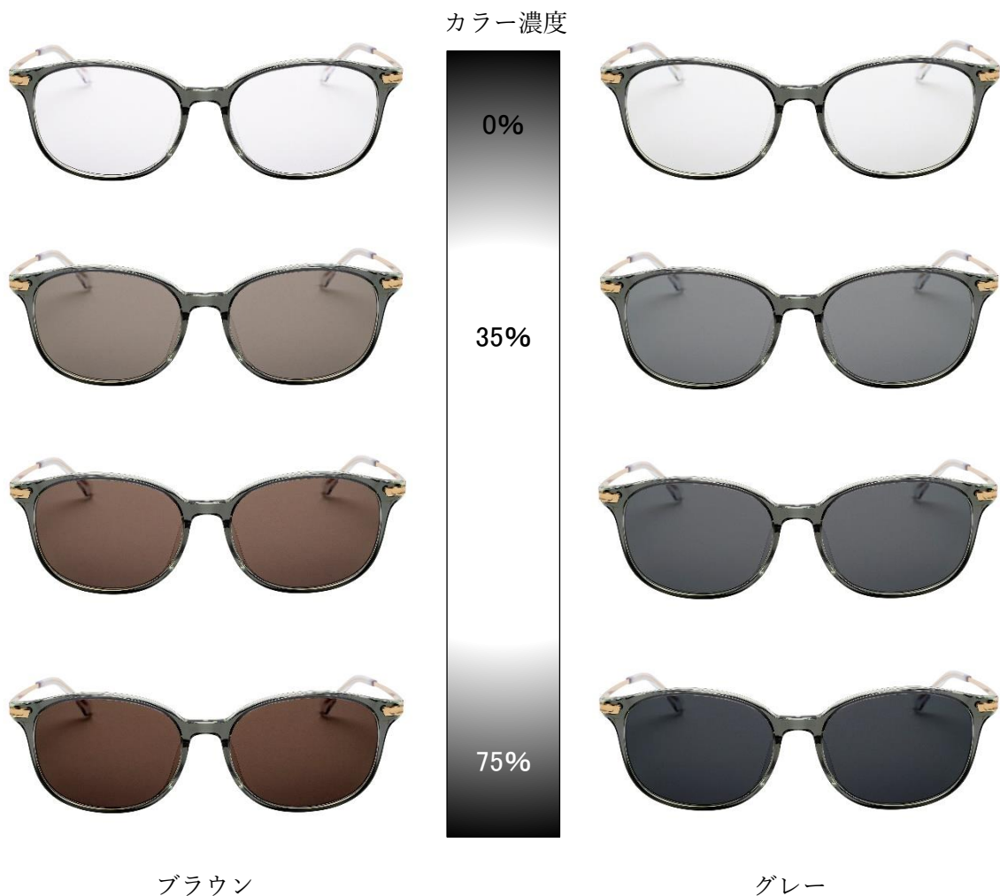
『新調光レンズ Active Sun』カラー濃度変化イメージ

※1 ブルーライトとは、波長 380～500nm (ナノメートル) の青色光のこと。可視光線の中で最も波長が短く、強いエネルギーを持っています。波長が短い (数値が小さい) ほどエネルギーは強くなり、目へのダメージが懸念されています。